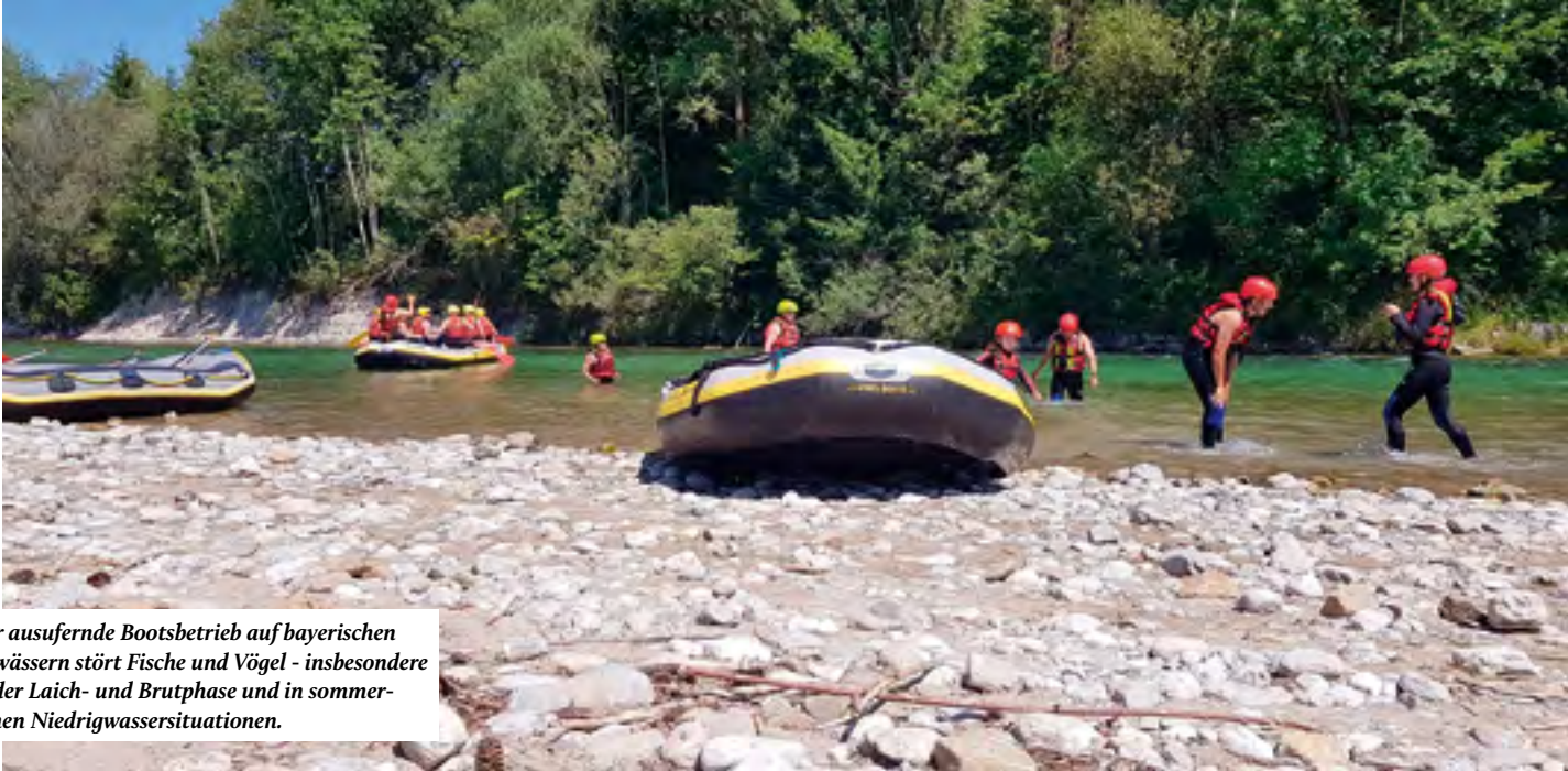
Der ausufernde Bootsbetrieb auf bayerischen Gewässern stört Fische und Vögel - insbesondere in der Laich- und Brutphase und in sommerlichen Niedrigwassersituationen.