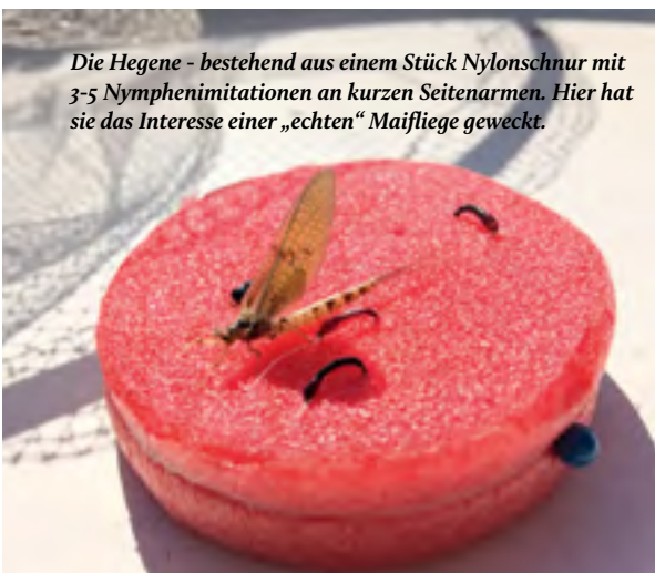
Die Hegene - bestehend aus einem Stück Nylonschnur mit 3-5 Nymphenimitationen an kurzen Seitenarmen. Hier hat sie das Interesse einer „echten“ Maifliege geweckt.

Am Anfang war die Hegene. Dieses kleine Konstrukt mit künstlichen Nymphen, die im Abstand von 30 - 40 Zentimeter am Seitenarm übereinander geknotet werden. Merken sie sich für den Anfang: Schwarz/Rot/Gold (14er Goldhaken, schwarzer Kopf, Körper rot oder schwarz). Dazu 16er Hauptschnur 18er Seitenarm (siehe Bild). Ganz unten hängt das Gewicht, darüber angeknüpft die zirka 1,50 Meter lange Hegene und die wiederum angeknötet an den Wirbel der Hauptschnur. Hegenen gibt es fertig zu kaufen, - dazu