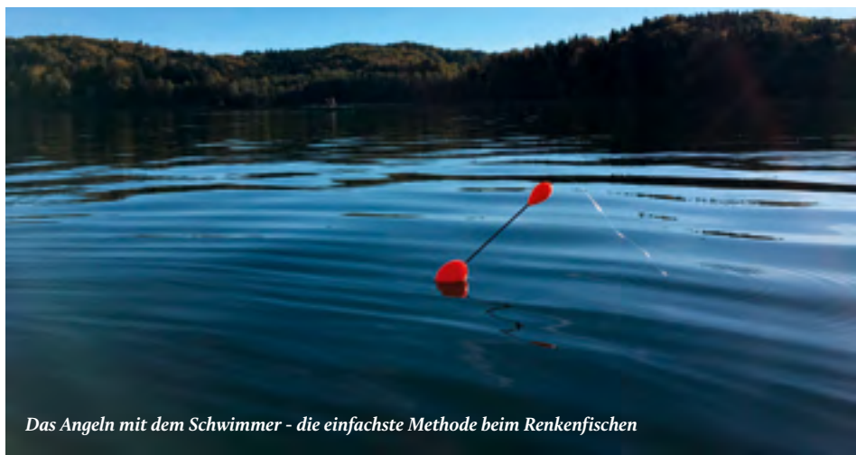
Das Angeln mit dem Schwimmer - die einfachste Methode beim Renkenfischen

Stellen wir uns vor, Freund Bernd empfiehlt, die Renken in Grundnähe zu suchen. Dann ist die einfachste Methode das Angeln mit dem Schwimmer, weil sie keine Spezialausrüstung brauchen. Es reichen eine sensible 3 Meter lange Float-Rute (15-40 Gramm Wurfgewicht) und eine 2000er Stationärrolle, auf der Hauptschnur sitzt ein Durchlauf-Schwimmer mit 40g Tragkraft. Jetzt kommt der einzige Haken an der Sache: sie müssen die exakte Tiefe einstellen, und zwar so, dass der Schwimmer schräg steht, also ganz leicht zu tief gestoppt ist. Werfen sie vom verankerten Boot aus ins tiefere Wasser und holen die Montage so lange