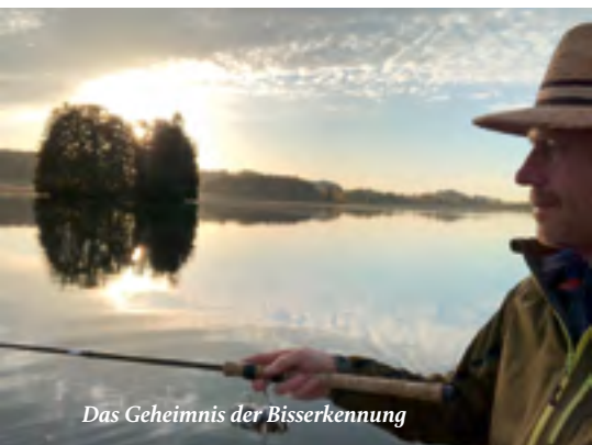
Das Geheimnis der Bisserkennung

Warum beißen Renken in künstliche Nymphen? Weil sie sehr realistisch aussehen und täuschend echt angeboten werden. Und bei dieser List hilft uns die Hegene – die Konstruktion macht sich die typische Nahrungsaufnahme der Renke zunutze. Der Fisch nimmt den Köder mit dem Maul nach unten und hebt kurz seinen Kopf. Hängt nun am unteren Ende der Schnur ein Gewicht, hakt sich der Fisch durch den Gegenzug selbst. Ein extra Anhieb ist nicht nötig. Entweder der Haken verfängt sich im Maul oder eben nicht. Gelegentliche Fehlrisse sind ganz normal. Nach dem Biss reicht es, zügig die Schnur zu spannen und Kontakt mit dem Fisch aufzunehmen.