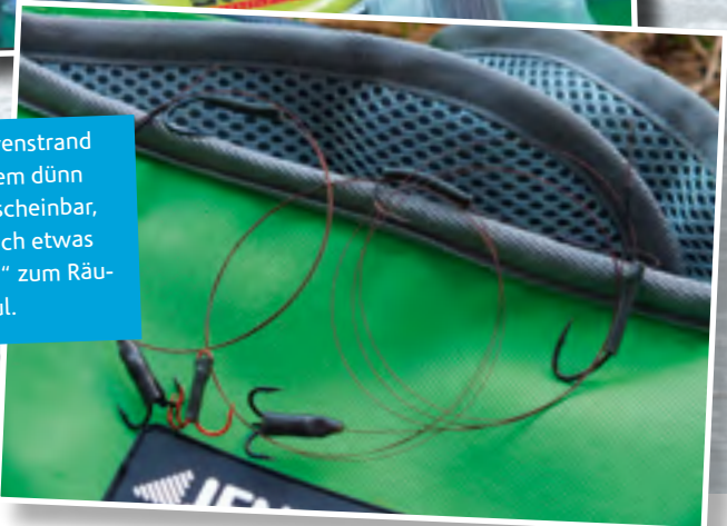
1x7 Sevenstrand ist extrem dünn und unscheinbar, aber auch etwas „scharf“ zum Räubermaul.