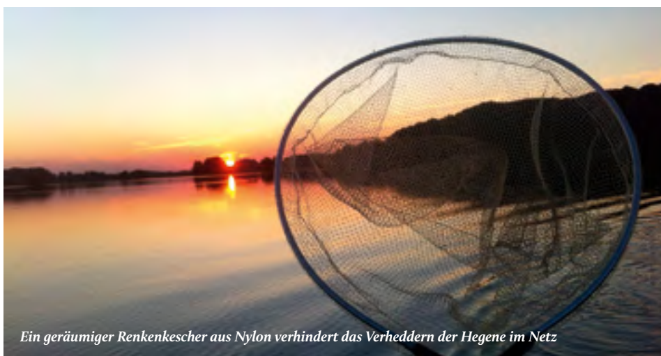
Ein geräumiger Renkenkescher aus Nylon verhindert das Verheddern der Hegene im Netz

flacher ein, bis der Schwimmer schräg steht. In dieser Position arbeitet er optimal, sprich die Nymphen werden unter Wasser vom ständigen Wippen des Schwimmers auf und ab bewegt. Beißt eine Renke, fällt der Schwimmer um, denn der Zug nach unten fehlt.