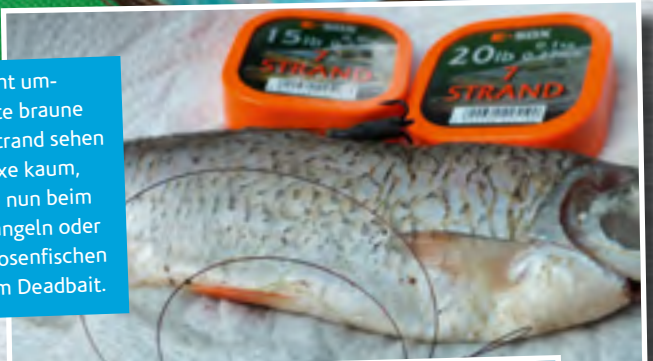
Das nicht ummantelte braune Sevenstrand sehen die Esoxe kaum, egal ob nun beim Grundangeln oder beim Posenfischen mit dem Deadbait.