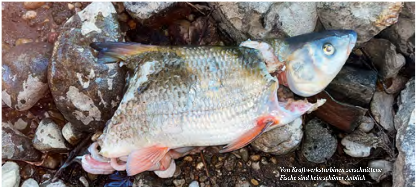
Von Kraftwerksturbinen zerschnittene Fische sind kein schöner Anblick

Expertenaustausch zum Schutz von Fischen an Wasserkraftanlagen