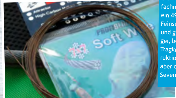
Ein 7x7 Stahlvorfachmaterial oder ein 49-fädiges Feinseil ist weicher und geschmeidiger, bei gleicher Tragkraft konstruktionsbedingt aber dicker als 1x7 Sevenstrand.

nylonummantelte Stahlvorfach lässt sich am schnellsten verarbeiten, ist am billigsten, und eignet sich daher am besten für Spinnsysteme, die ja oft schnell verschleifen. Klarer Vorteil des Selber-Bauens von Stahlvorfächern ist, dass ihr je nach Trübung, Hechtbestand, Größe der Fische und Angelart das passende Vorfach wählen könnt. Ihr spart echtes Geld, und Spaß macht es auch!