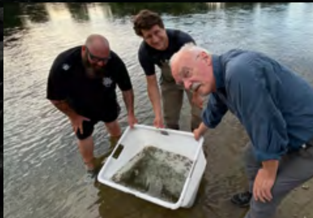
Auswildern von kleinen Zingeln an einem renaturierten Donauabschnitt bei Eining. Gemeinsam getragen vom Landesamt für Umwelt, vom LFV Bayern und dem Kreisfischereiverein Kelheim soll die Fischart hier im Rahmen des Wiederansiedlungsprojektes eine dauerhafte Population ausbilden.

Daher ist die Bestandsstärkung durch Nachzucht nur ein Aspekt, mindestens ebenso wichtig ist der Erhalt freifließender Donauabschnitte und die Wiederherstellung der natürlichen Lebensräume.