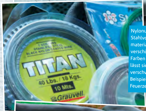
Nylonummanteltes Stahlvorfachmaterial gibts in verschiedenen Farben und es lässt sich einfach verschweißen, zum Beispiel mit einem Feuerzeug.