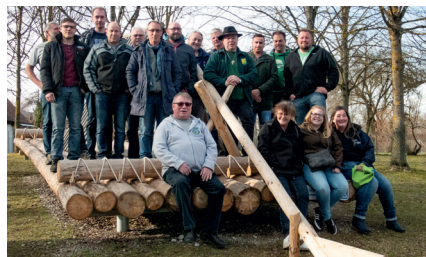
Gruppenbild auf einem Lechfloß vor dem Lechmuseum in Langweid.