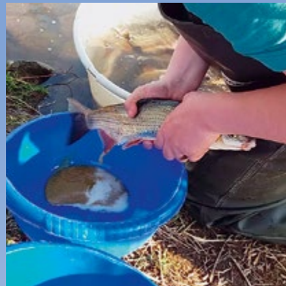
Die Nasen werden vor Ort sofort behutsam abgestreift und in die Vils zurückgesetzt.