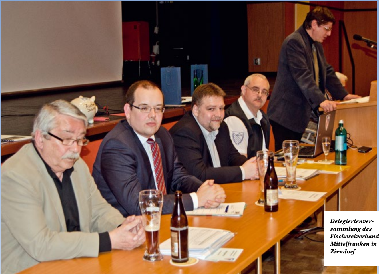
Delegiertenversammlung des Fischereiverbandes Mittelfranken in Zirndorf