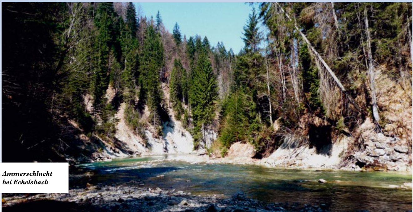
Ammerschluft bei Echelsbach