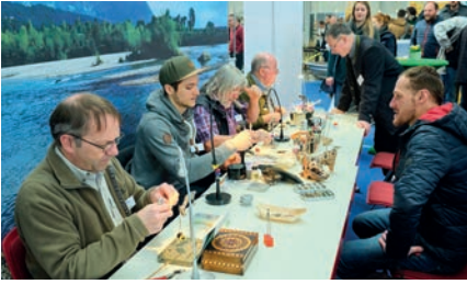
Auf großes Interesse stießen wie jedes Jahr die Vorführungen der Fliegenbinder.