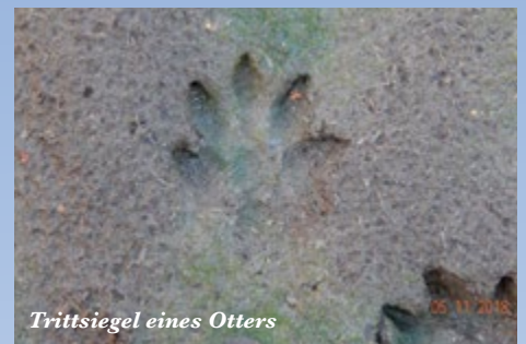
Trittsiegel eines Otters