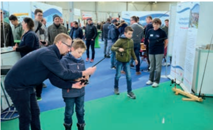
Hier lässt sich ein Junge in die Kunst des Castings einführen.