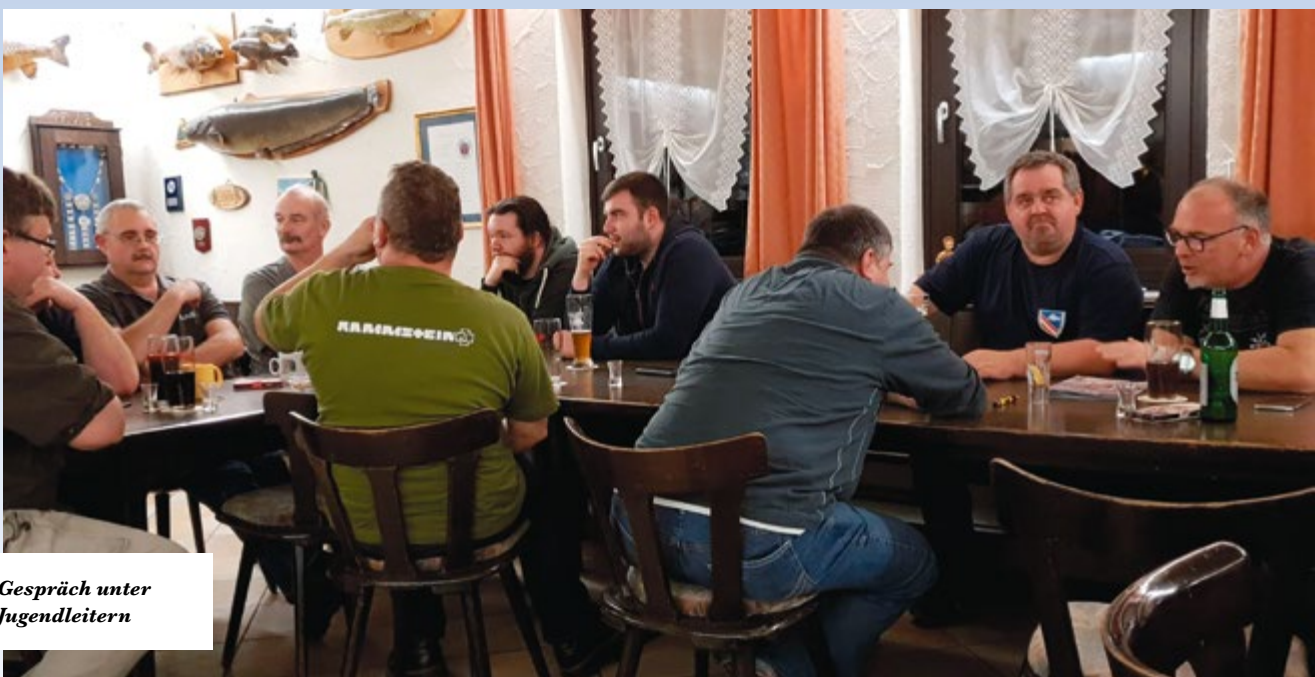
Gespräch unter Jugendleitern