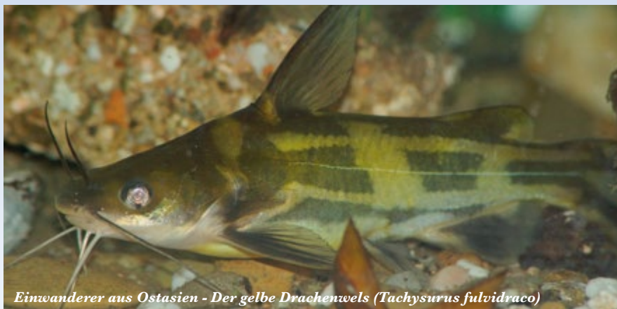
Einwanderer aus Ostasien - Der gelbe Drachenwels ( Tachysurus fulvidraco )

besten verwendet man hierzu den Fragebogen des LFV, der unter https://lfvbayern.de/schuetzen/fischotter/grosse-fischotter-umfrage-2128.html heruntergeladen oder online ausgefüllt werden kann. Meldungen können aber auch telefonisch oder per Email eingereicht werden. Zusätzlich kann eine Meldung an einen der beiden Oberpfälzer Otterberater (LK TIR, NEW, AS: Alexander Horn, Alexander.Horn@Tirschenreuth.de ; LK NM, SAD, R, CHA: Peter Ertl, Peter.Ertl@LfL.bayern.de ) erfolgen. Diese sind zwar überwiegend für die Teichwirtschaft zuständig, nehmen die Hinweise von freien Fließgewässern aber gerne auf.