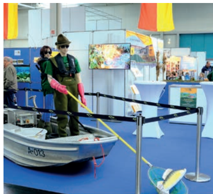
Die Fischereifachberatung des Bezirks Schwaben informierte die Besucher in gewohnt professioneller Weise. Schwerpunktthema war dieses Jahr die Elektrofischerei, eine schonende Methode, um den Fischbestand zu erfassen.