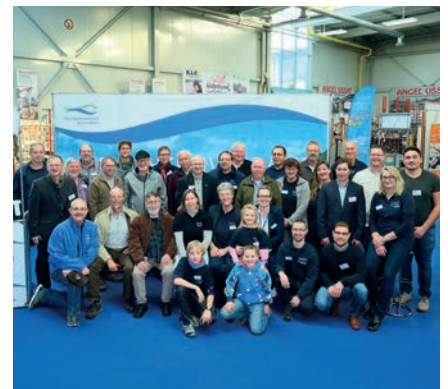
Der Fischereiverband Schwaben bedankt sich bei den zahlreichen ehrenamtlichen Helfern. Ohne deren leidenschaftlichen Einsatz wäre die tolle Präsentation der Fischerei auf der Messe „JAGEN UND FISCHEN“ gar nicht möglich.