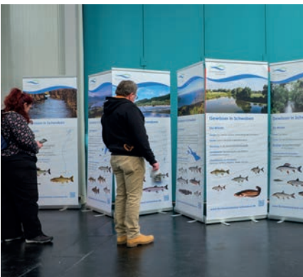
Eine informative Präsentation: Sehr viele Besucher interessierten sich für die Flüsse in Schwaben und deren Fischvorkommen.